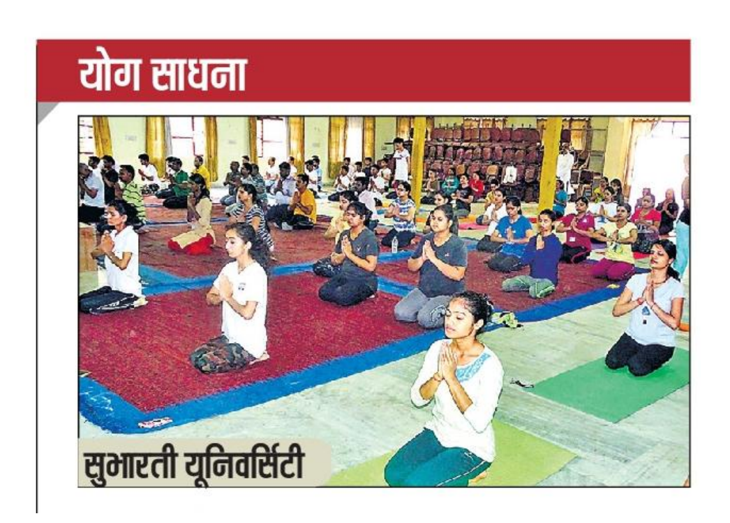
Yoga Practice in Subharti University